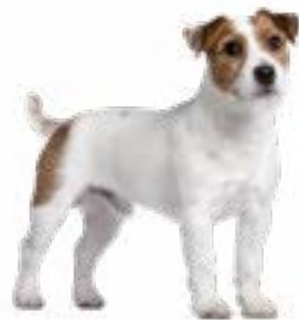
Džeka Rasela terjers