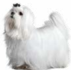
Malta zīda sunītis

Mājputnu gaļa (25%), kukurūza, rīsi (14%), mieži, mājputnu gaļas tauki, jēra gaļa (4%), biešu mīkstums, minerāli, raugs (2%), linsēklas, olu pulveris (1%), lašu eļļa (1%), lecitīns (0,5%), inulīns (0,4%), jukas augs (0,01%)