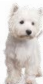
Vesthailendas baltais terjers

Mājputnu gaļa (32%), kukurūza, rīsi (min. 14%), mieži, mājputnu gaļas tauki, biešu mīksts, minerāli, raugs (1%), linsēklas, olu pulveris (1%), lašu eļļa (0,5%), inulīns (0,4%), lecitīns (0,3%), hondroitīns (0,1%), glikozamīns (0,1%), jukas augs (0,01%).